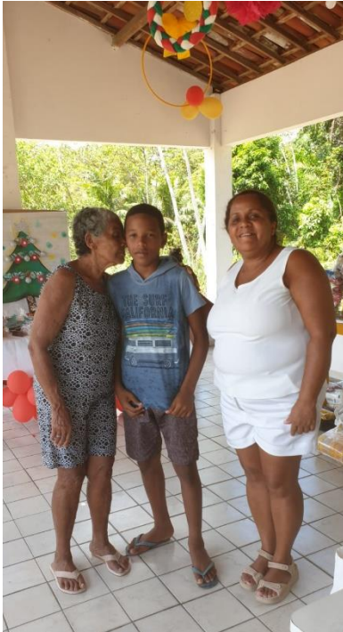
Festa de Natal com as famílias