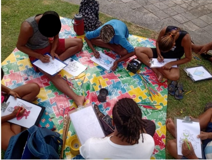
Figura 1. Atividade: Aproximação Socioeducativa