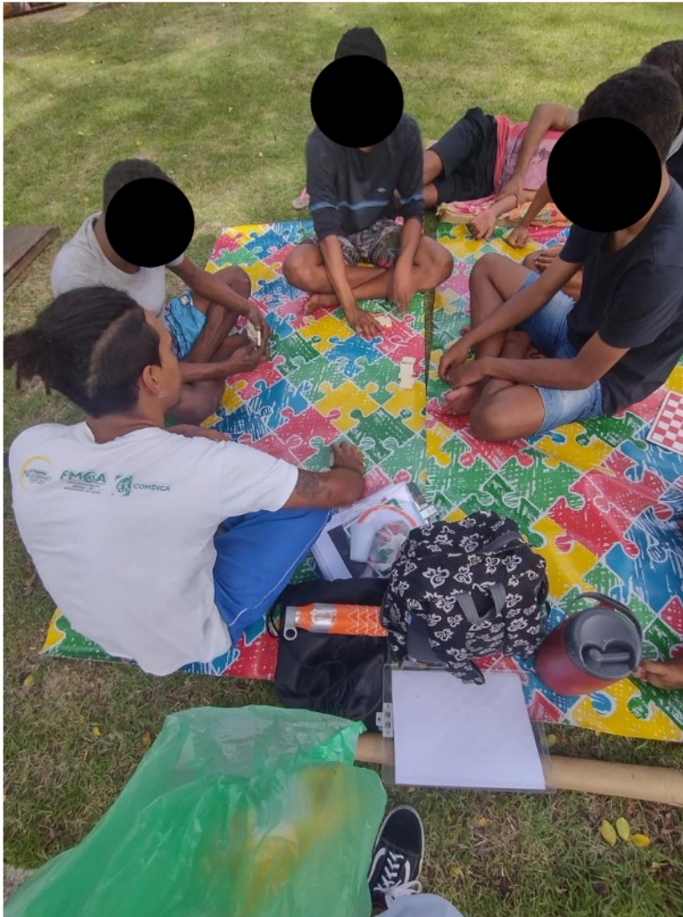
Figura 3. Atividade: Intervenção Psicoeducativa