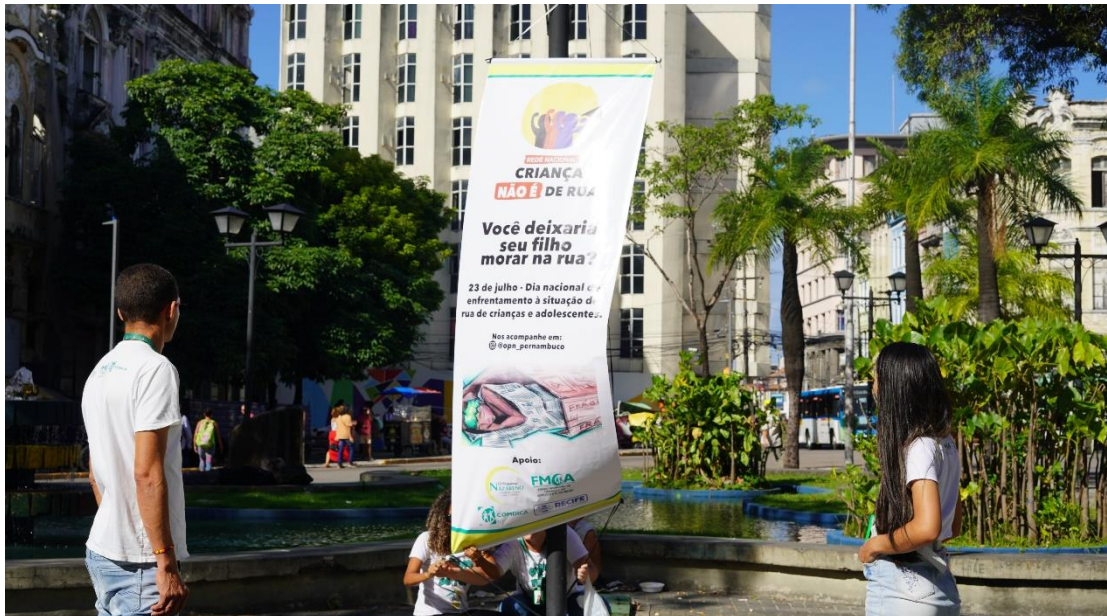
Figura 18. Atividade: Articulação Política