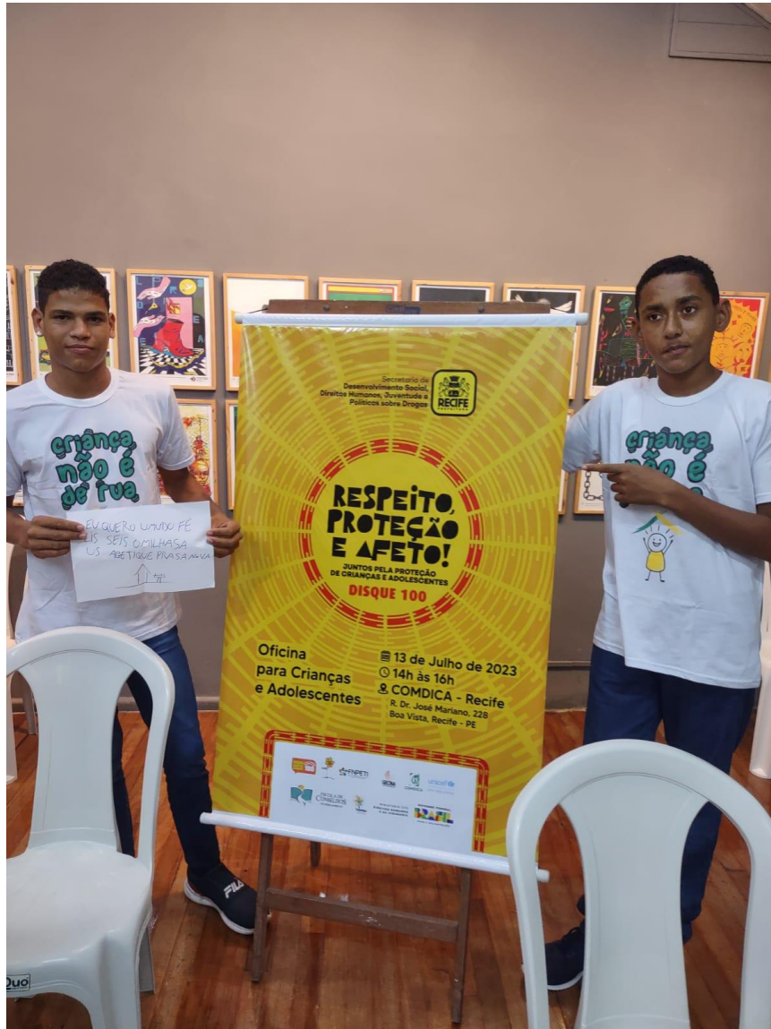
Figura 17. Atividade: Seminário e Oficina