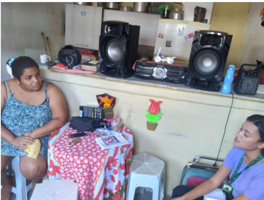
Figura 6. Atividade: Visita Domiciliar