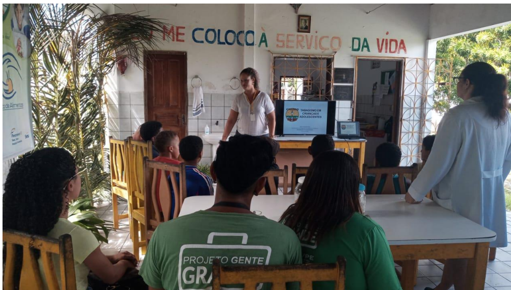
Figura 16. Atividade: Palestra