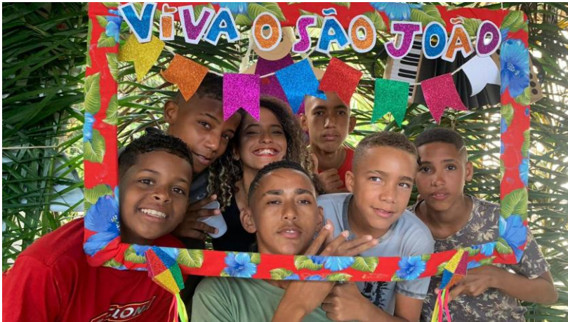
Figura 13. Atividade: Recreativa (Comemoração as Festas Juninas) Data: 22/06/2023 Local: Sítio de Acolhimento Organização: O Pequeno Nazareno