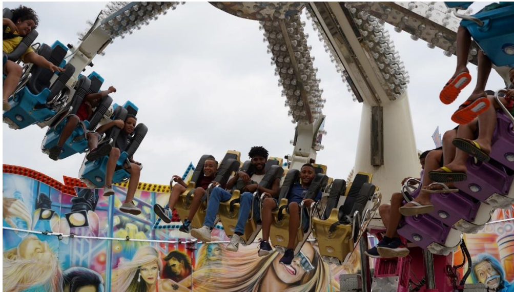
Figura 11. Atividade: Recreativa (Passeio ao Parque de Diversões – Mirabilândia) Data: 19/07/2023 Local: Parque de Diversões Mirabilândia, Salgadinho – Olinda / PE Organização: O Pequeno Nazareno