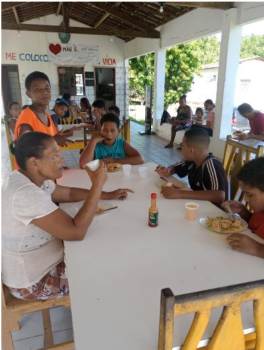
Figura 8. Atividade: Encontro de Socialização