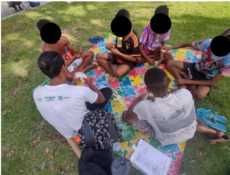
Figura 3. Atividade: Intervenção Psicoeducativa