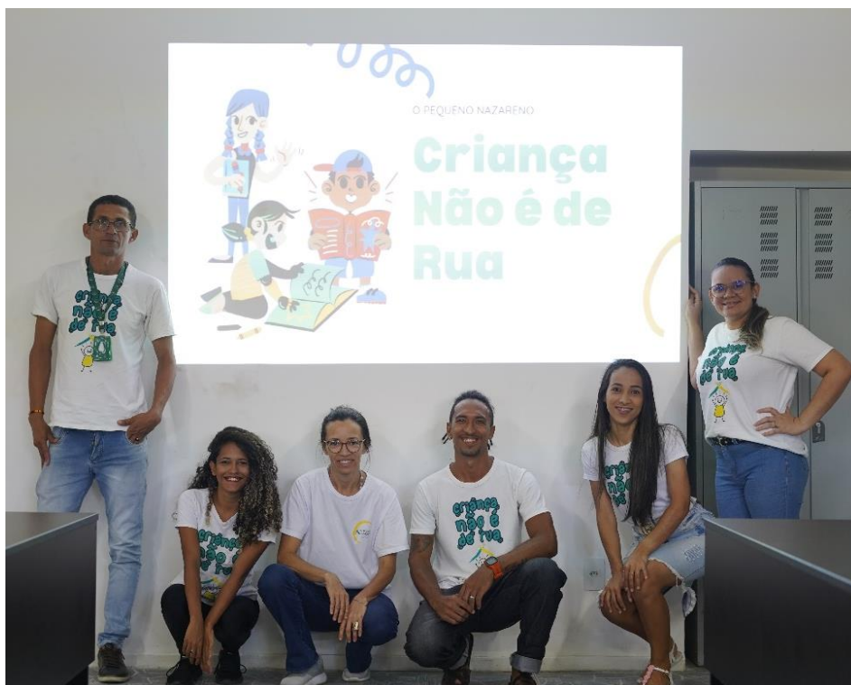
Figura 8. Atividade: Reunião com famílias

Tema: Alusão ao Dia Nacional de Enfrentamento à Situação de Rua de Crianças e Adolescentes