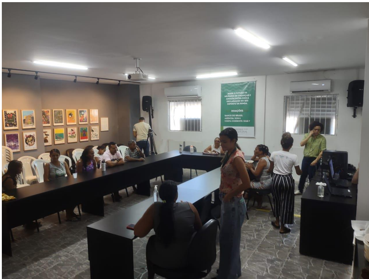
Figura 9. Atividade: Reunião com famílias Tema: Drogadição na Infância e Adolescência Data: 16/06/2023