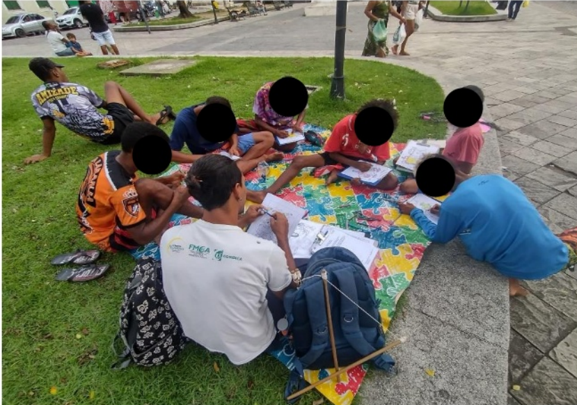
Figura 1. Atividade: Aproximação Socioeducativa