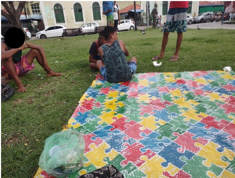
Figura 4. Atividade: Intervenção Psicoeducativa