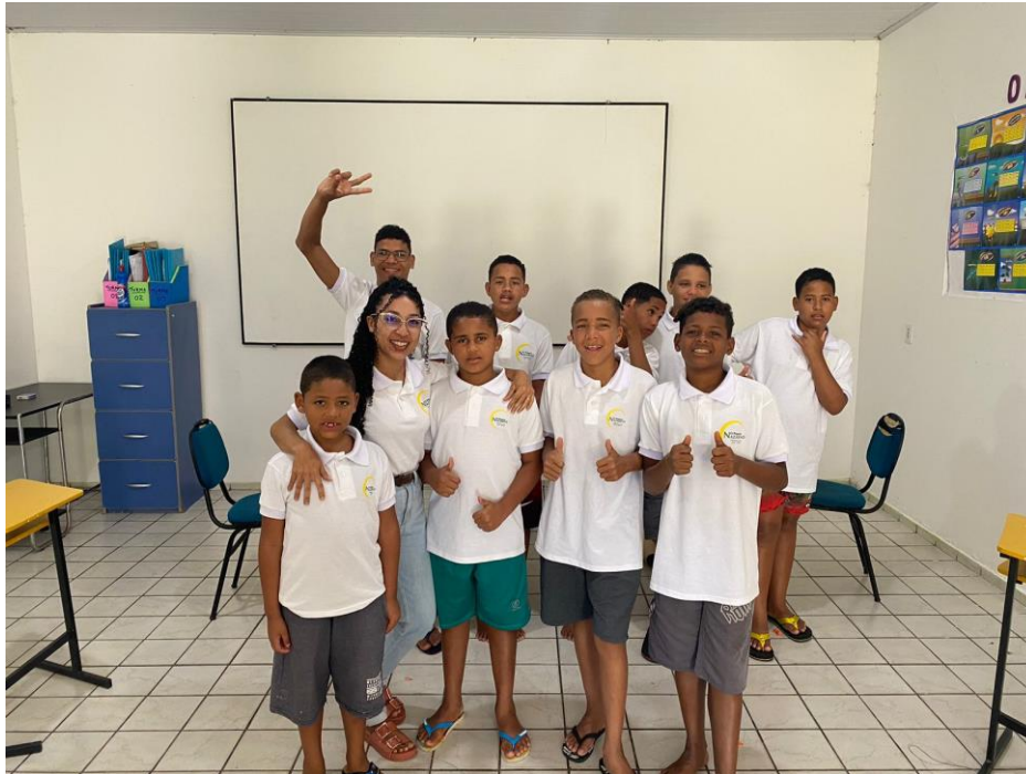
Figura 21. Aquisição de Fardamento Data do pagamento: 04/07/2023, entregue em 31/07/2023 Beneficiários: Equipe Profissional e Alunos da Escola O Pequeno Nazareno