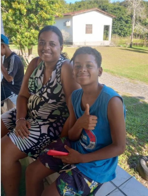
Figura 7. Atividade: Encontro de Socialização