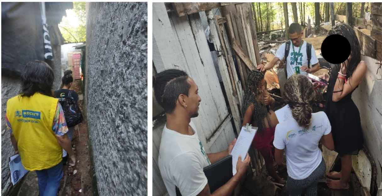
Figura 5. Atividade: Visita Domiciliar