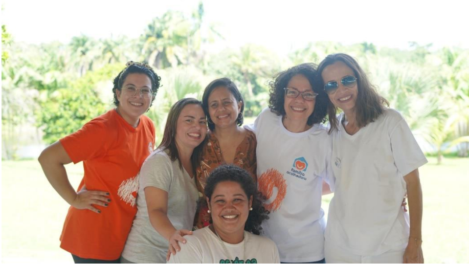
Figura 15. Atividade: Recreativa (Intercâmbio de Férias)