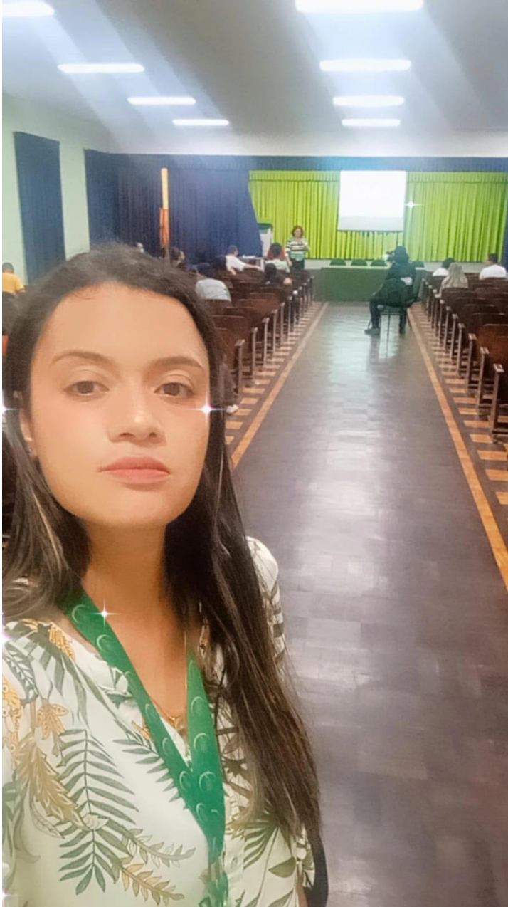
Figura 15. Atividade: Seminário