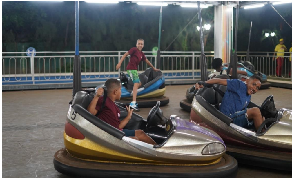
Figura 12. Atividade: Recreativa (Passeio ao Parque de Diversões – Mirabilândia) Data: 19/07/2023 Local: Parque de Diversões Mirabilândia, Salgadinho – Olinda / PE Organização: O Pequeno Nazareno