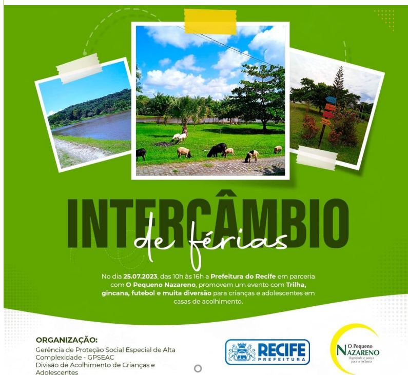
Figura 14. Atividade: Recreativa (Intercâmbio de Férias) Data: 25/07/2023 Local: Sítio de Acolhimento do Pequeno Nazareno, Ilha de Itamaracá Organização: Gerência de Proteção Social Especial de Alta Complexidade da Prefeitura da Cidade do Recife e Associação Beneficente o Pequeno Nazareno