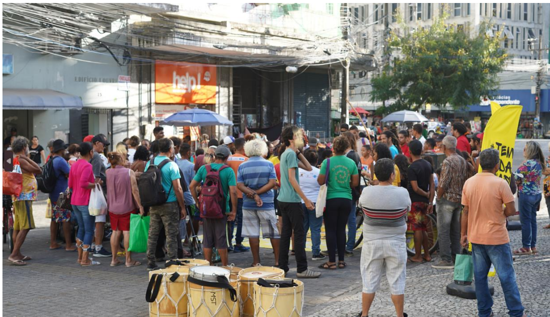
Figura 19. Atividade: Articulação Política

Participantes do movimento: Organizações governamentais e não governamentais