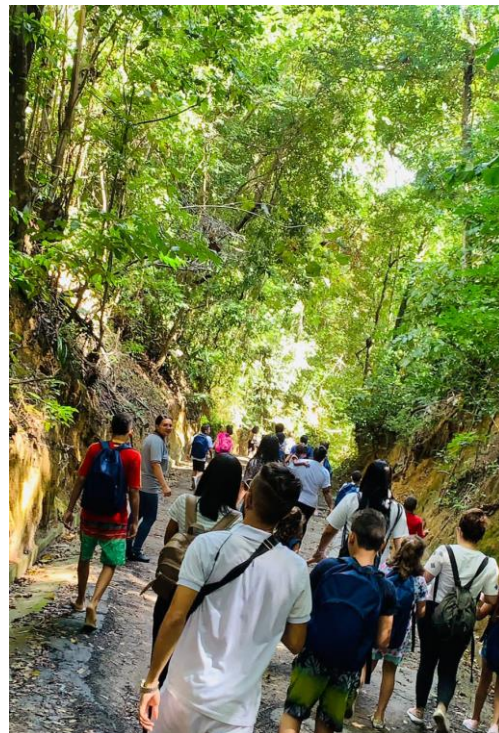
Figura 16. Atividade: Recreativa (Intercâmbio de Férias)