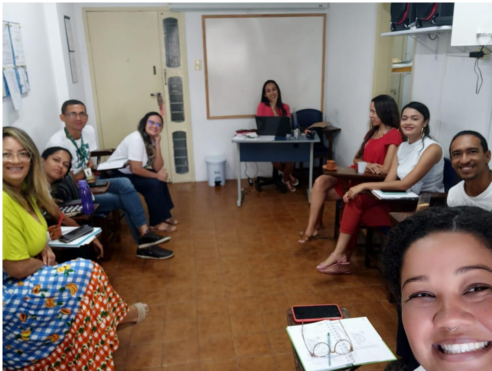
Figura 17. Atividade: Reunião de Equipe