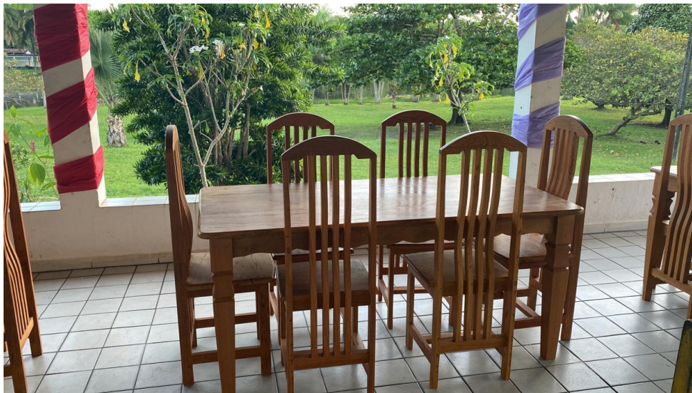
Figura 22. Aquisição de 03 Conjuntos de mesa com 6 cadeiras em madeira Data do pagamento e entrega: 19/07/2023 Beneficiários: Público em geral