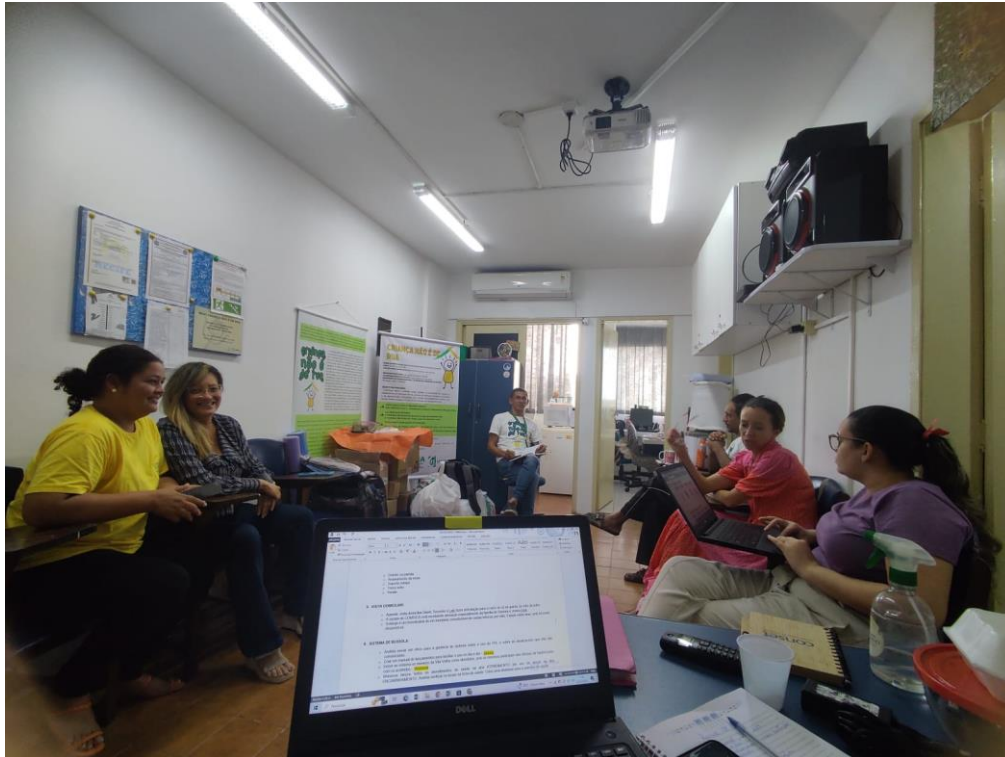
Figura 20. Atividade: Reunião de Equipe