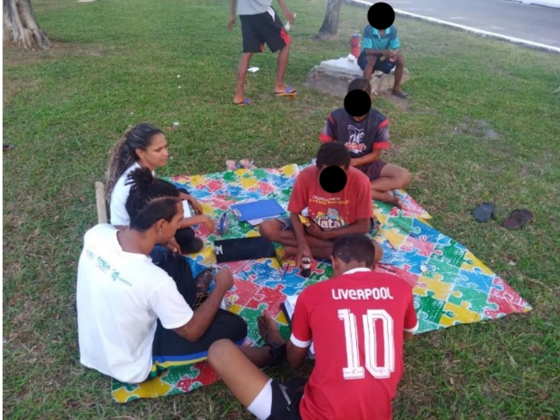
Figura 1. Atividade: Aproximação Socioeducativa