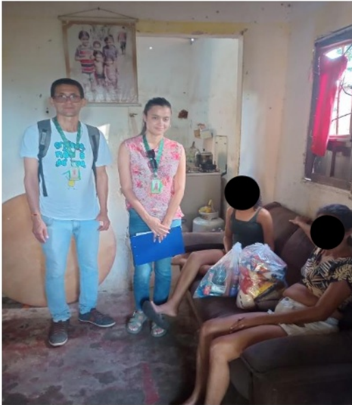
Figura 3. Atividade: Visita Domiciliar