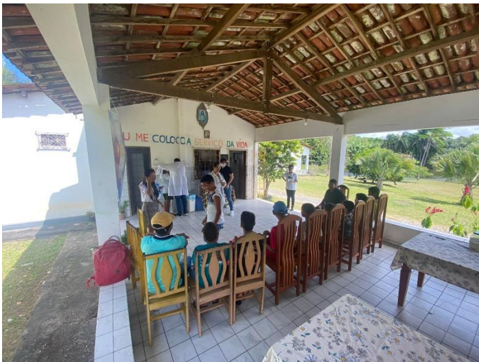
Figura 14. Palestra sobre verminose, ministradas pelos profissionais de saúde da Unidade de Saúde da Família de Vila Velha

Participantes: Acolhidos, técnicos da OPN e Profissionais da área de saúde