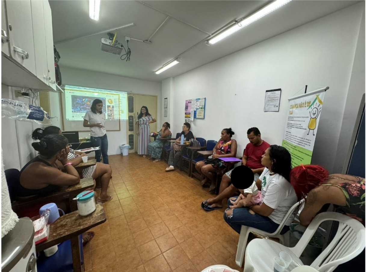
Figura 7. Atividade: Reunião com famílias

Tema: Funcionamento dos serviços do CREAS e elucidação de dúvidas