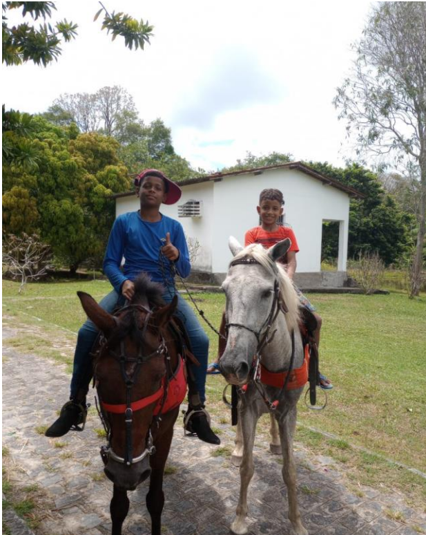
Figura 9. Atividade: Recreativa (Passeio de Cavalo) Data: 21/10/2023 Local: Sítio de Acolhimento – Ilha de Itamaracá/PE Participantes: Acolhidos e técnicos da OPN