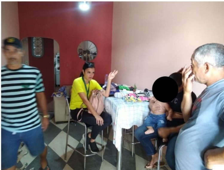
Figura 3. Atividade: Visita Domiciliar