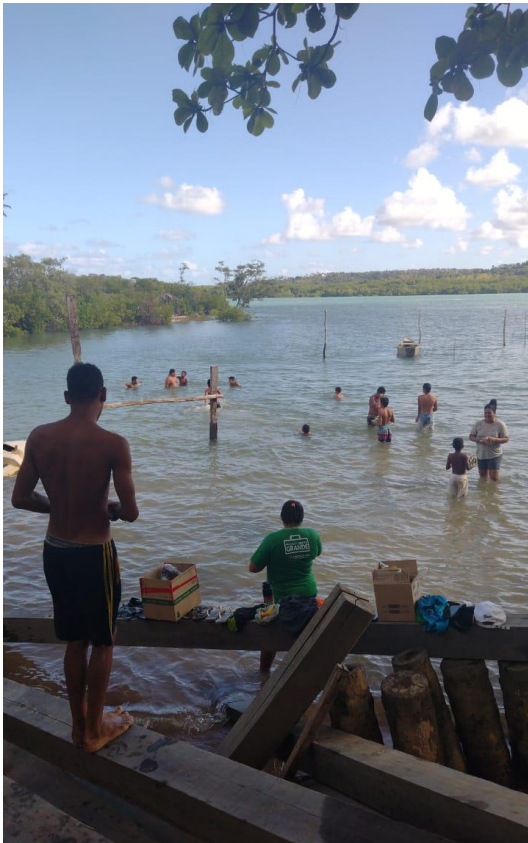
Figura 9. Atividade: Recreativa (Passeio a Prainha)