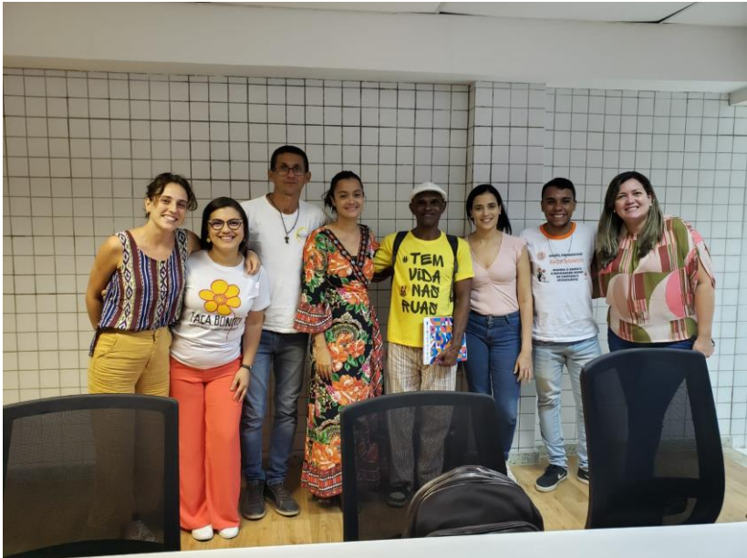
Figura 11. Reunião de reavaliação da construção do Plano de situação de rua no COMDICA Data:23/10/2023 Local: Auditório COMDICA Participantes: Instituições diversas