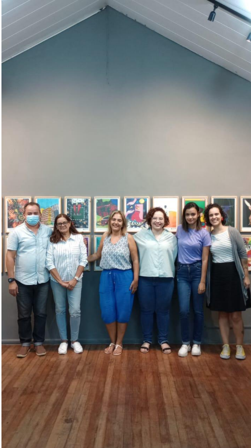
Figura 14. Reunião COMDICA para elaboração do Plano de Situação de Rua (Cancelada devido à baixa adesão de participantes) Data: 16/11/2023 Participantes: Técnicos OPN e instituições ligada ao seguimento.