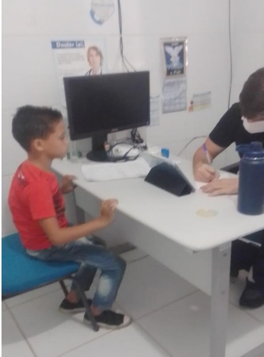
Figura 12. Consulta com Clínico Geral