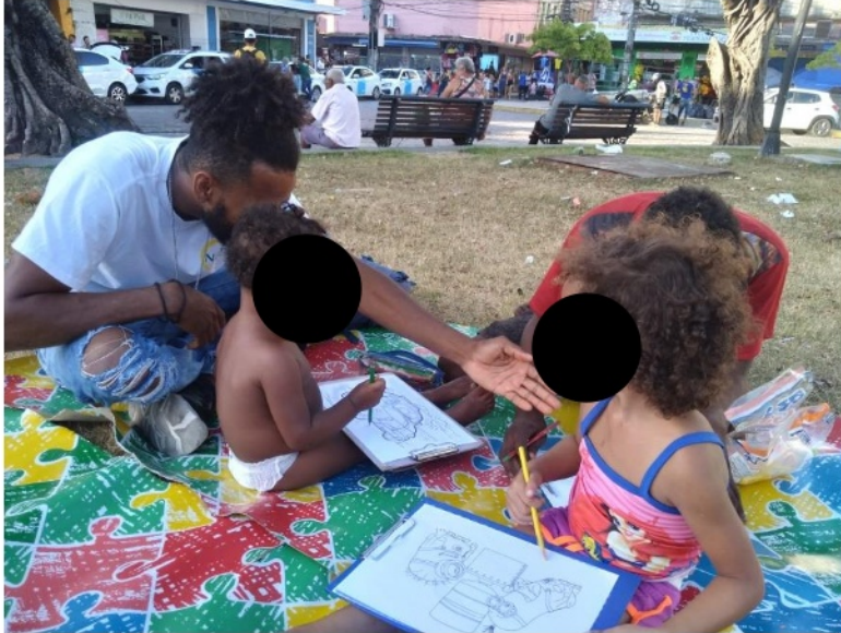
Figura 1. Atividade: Aproximação Socioeducativa