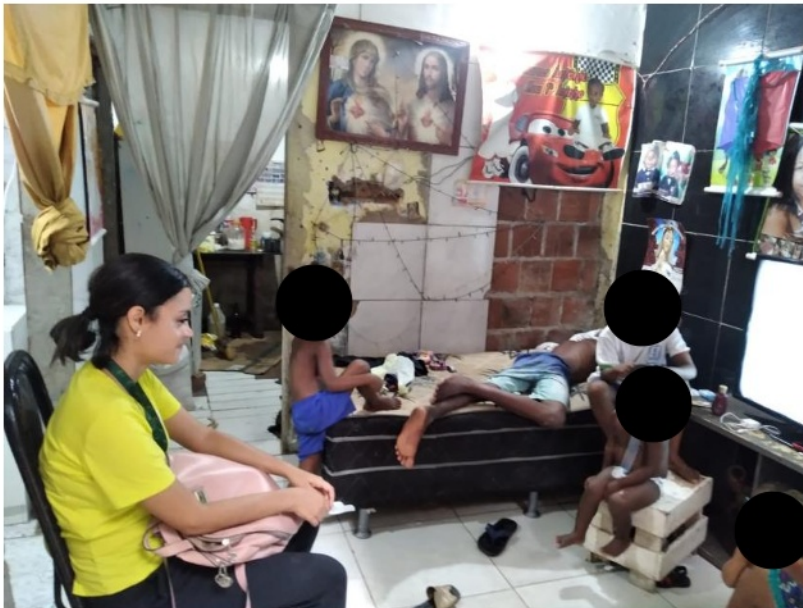
Figura 4. Atividade: Visita Domiciliar