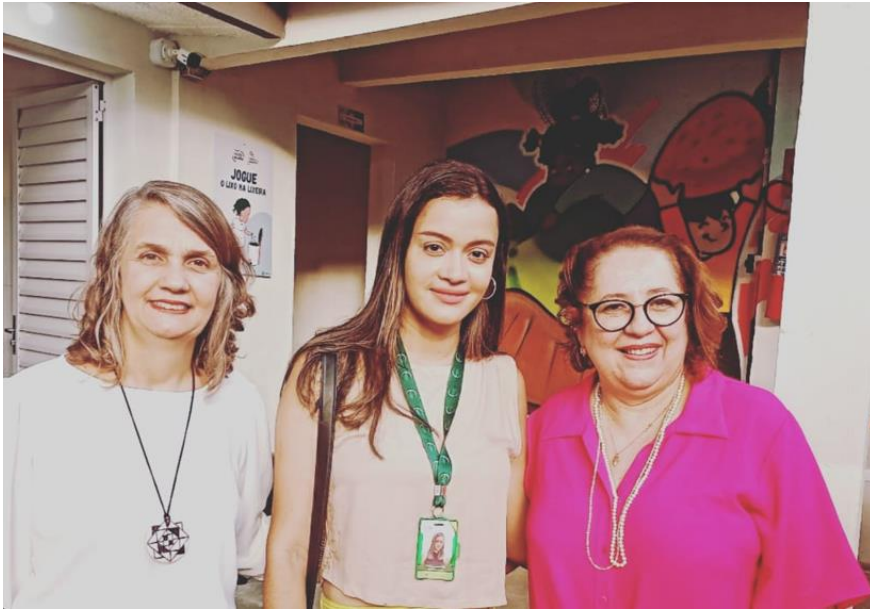
Figura 15. Inauguração do Centro Popinho