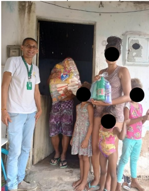
Figura 4. Atividade: Visita Domiciliar