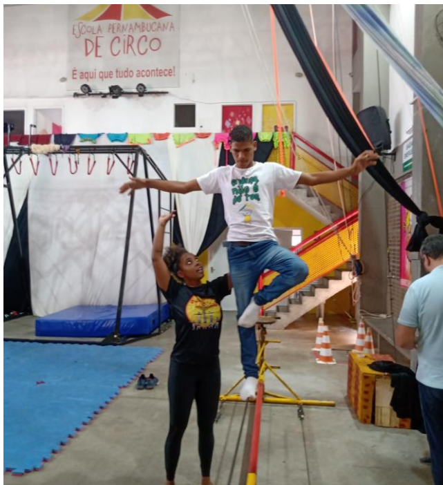
Figura 12. Oficina de Circo - Atividade do FOSCAR, objetiva despertar o gosto pela arte circense Data:28/10/2023 Local: Auditório COMDICA Participantes: Instituições diversas