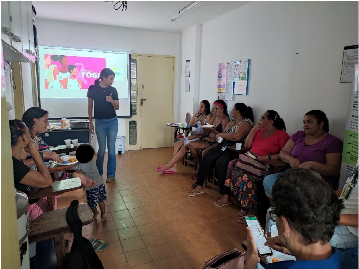
Figura 7. Atividade: Reunião com famílias

Tema: Outubro Rosa – Prevenção ao Câncer de mama